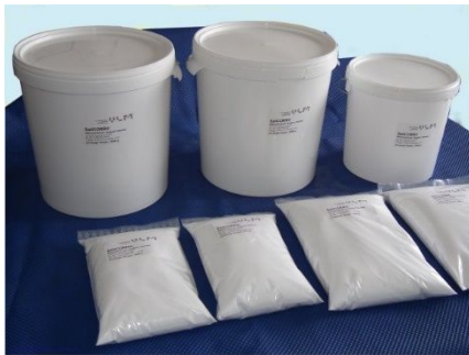
Conditionnements disponibles SaliCORR®