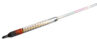
Aréomètre selon ISO 9227