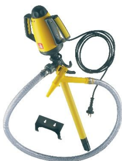
Pompe de dissolution NaCl